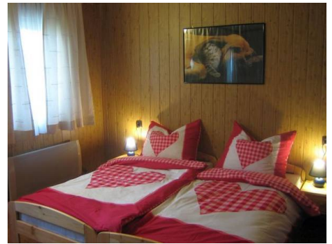
Schlafen Sie gut

Weitere Informationen finden Sie auf unserer Homepage unter http://www.dreampark.at