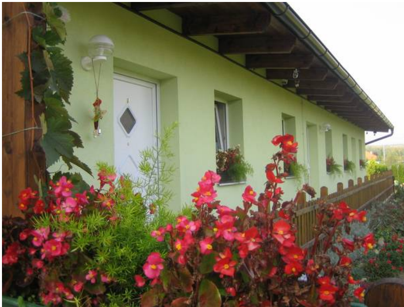
Blick zu den Wohnungen

Neu erbaute Studios für 2 bis 3 Personen in einer 1500 qm Garten/Parkanlage mit beheiztem 30 000 Liter Pool.