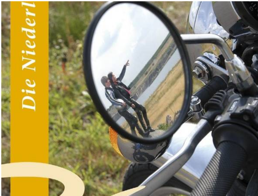
Aktualisierte Motorradkarte für die Niederlausitz

Auf heißen Rädern entlang bizarrer Mondlandschaften und neu entstehender Seen.