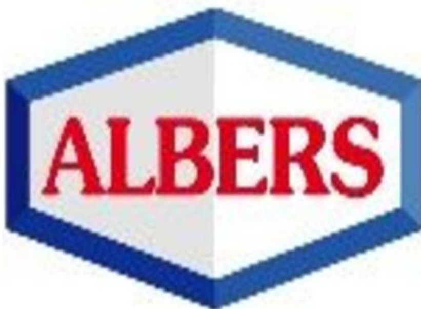
Logo des Fleischexperten Albers